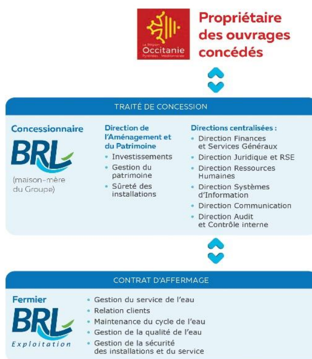
Schéma d'organisation du Réseau Hydraulique Régional